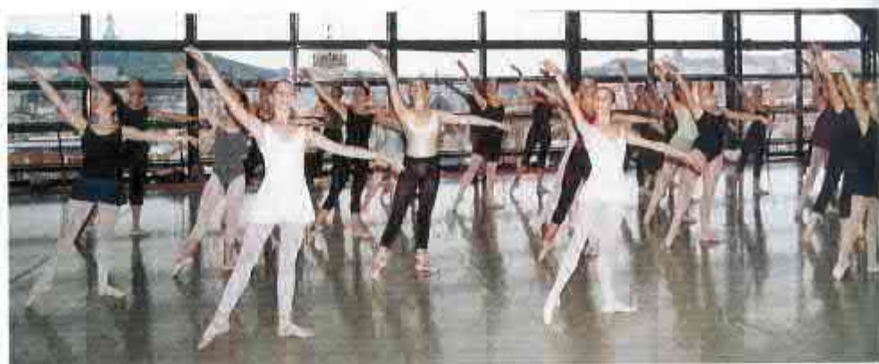
La leçon d'Elisabeth Platel, niveau supérieur