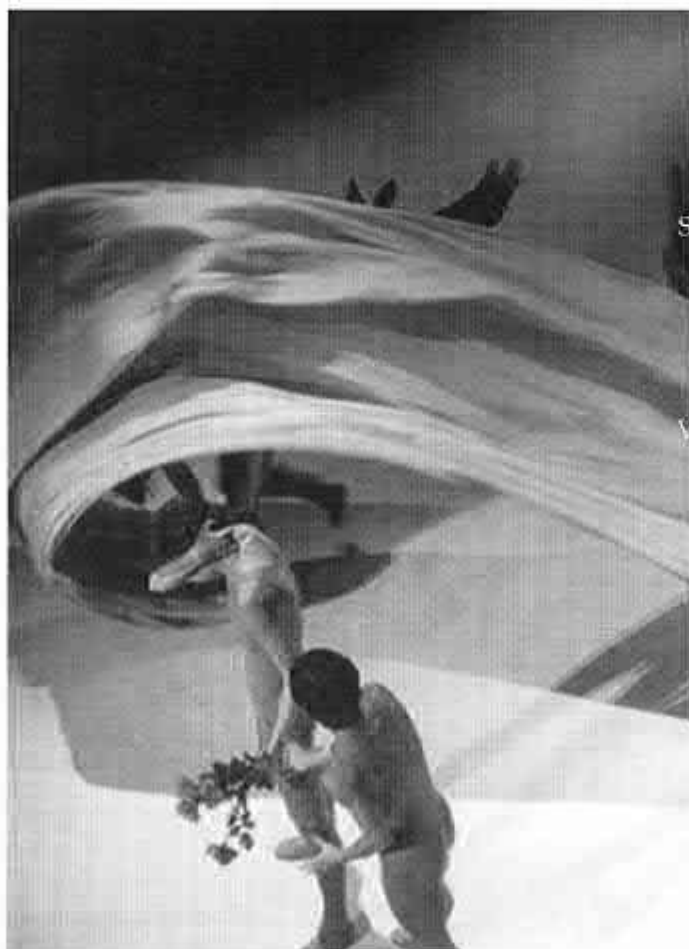
Biennale de la Photographie de Danse, Budapest